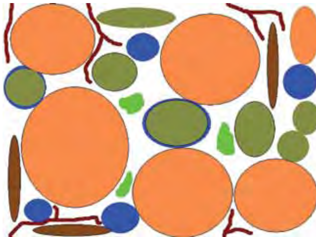
Figure 1: Soil water is held in spaces between soil particles. (Graphic: P. Toome 2011)

Plants use water from the largest pores first. As the soil dries it becomes increasingly difficult for plant roots to remove the remaining soil water. Different plants have varying ability to “suck” water from the soils. For example vegetables are only able to apply a relatively weak suction to extract water from soil and can access less water than a stronger growing plant such as a grapevine.